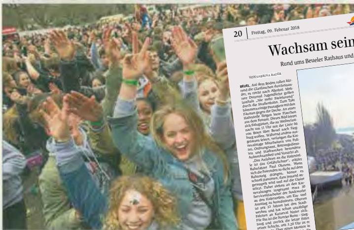
Jetzt geht die Party richtig los! Abiturienten aus 29 Schulen feiern ihren letzten Schultag auf der Rigal'schen Wiese

1700 Abiturienten feiern den letzten Schultag auf der Rigal'schen Wiese