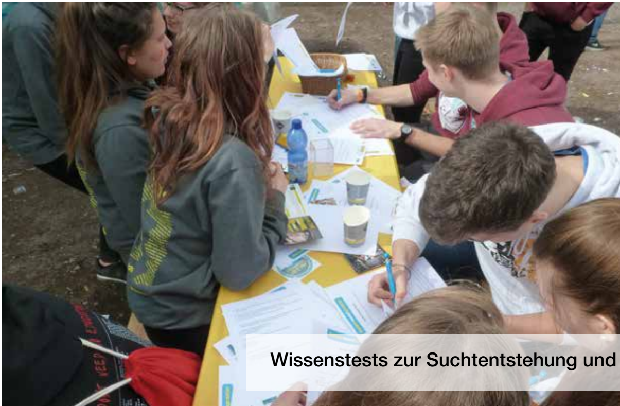
Wissenstests zur Suchtentstehung und Substanzen