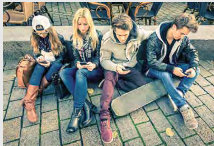
Informationsmaterialien zum Thema digitale Medien