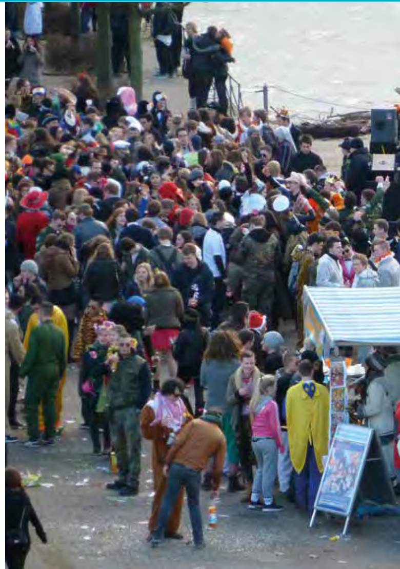
Der bonner event sprinter im Einsatz: Weiberfastnacht 2018 an der Beueler

update Fachstelle für Suchtprävention der Ambulanten Suchthilfe Caritas/Diakonie ist verantwortlich für die Koordination des Gesamtprojektes und der