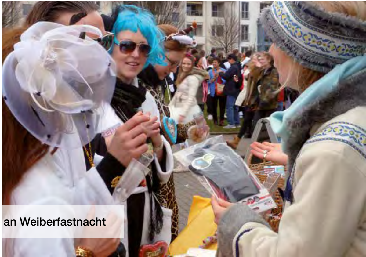
Tauschbörse an Weiberfastnacht