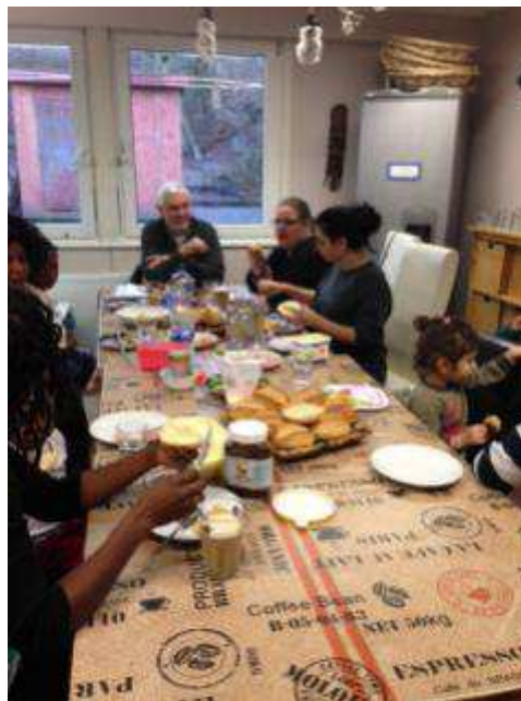
Abbildung 1: Das gemeinsame Frühstück bei update

Wie im vergangenen Jahr unterstützt update weiterhin das Spielhaus Medinghoven, eine städtische Freizeiteinrichtung für Kinder von 6 – 14 Jahren bei der Durchführung des elterlichen Frühstücks PLUS. Dieses wöchentliche Angebot richtet sich an Eltern mit Kleinkindern (0 – 6 Jahre), die im Rahmen eines gemeinsamen Frühstücks die Möglichkeit haben, über ihren Alltag zu sprechen und Erfahrungen miteinander auszutauschen. Auf Anfrage kommt ein Mitarbeiter von update zu suchtspezifischen Fragestellungen hinzu. Dieses Angebot erfährt eine sehr akzeptierende Haltung seitens der Teilnehmenden und wird kontinuierlich genutzt.