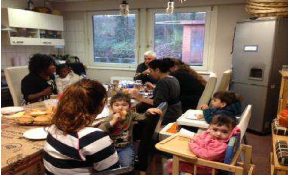
Abbildung 2: Groß und klein. Kontakte werden geknüpft.

Unter fachlicher Anleitung können sich die Teilnehmenden kritisch mit ihrer Elternrolle auseinandersetzen und dabei insbesondere ihre Vorbildfunktion im Erziehungsverhalten reflektieren. Dieser Austausch über ein bisher tabuisiertes Thema führt zu einer merklichen Entlastung der Eltern und ermöglicht es darüber hinaus, dass Scham- und Schuldgefühle deutlich zurücktreten können. Somit werden durch die Arbeit mit den Eltern die Kinder dieser suchtblasteten Familiensysteme gegen die Entwicklung einer möglichen eigenen Abhängigkeitserkrankung gestärkt.